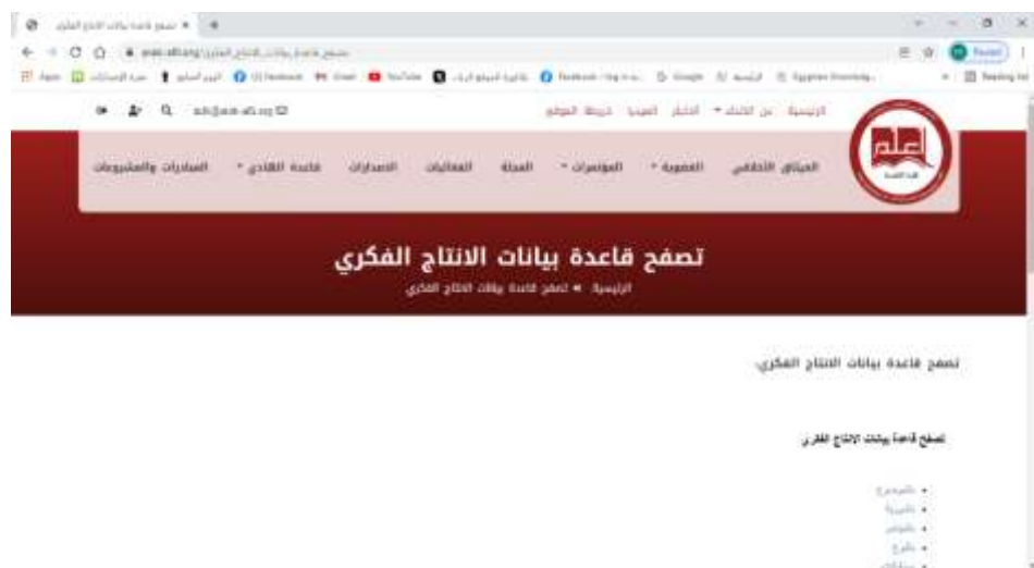
شكل (1) الصفحة الرئيسية لقاعدة الهادي على موقع الإتحاد العربي للمكتبات والمعلومات

و بعد ملاحظة أن تعدد مجلدات دليل الإنتاج الفكري عبر تاريخه الطويل 1976-2021 (12 مجلد) جعل البحث فيه صعبا ويستغرق وقتا طويلا وتنقلا من مجلد لآخر ومن ثم اتخذ القرار لعمل قاعدة تغطي الانتاج الفكري كله في كيان واحد واتاحة بيانات عنه بسهولة وبسرعة على نطاق واسع، فضلا عن إمكانية اتاحة مستخلصات و/أو روابط للنصوص الكاملة فيما بعد، وهو ما لا يمكن عمله في النسخة المطبوعة ، انظر شكل(1).